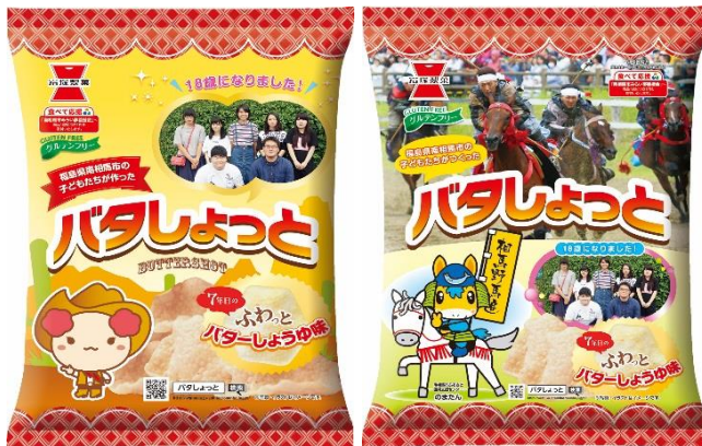
相馬野馬追デザイン