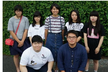
高校3年生になった子どもたち

「家族みんなで食べてほしい」をコンセプトにした、ふわっと柔らかいひとロサイズの米粉スナックは、2013年の発売以来お客様から大変ご好評をいただき、毎年期間限定で発売しています。